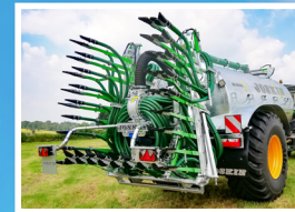
Kompaktowe wymiary po podwójnym złożeniu z tyłu wozu